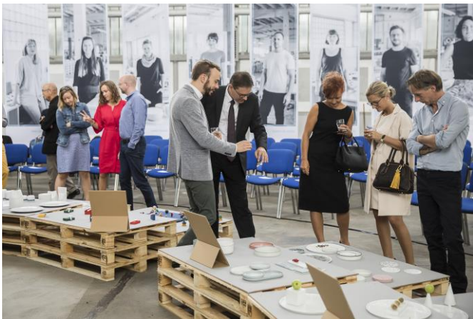
Diskussion der Forumsteilnehmer