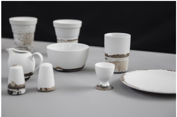
Mit Buttermilch glasiertes Porzellan